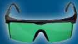
Lazer Gözlüğü - yeşil