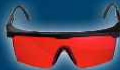
Lazer Gözlüğü - kırmızı