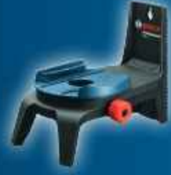
RM 2 döner montaj aparatı