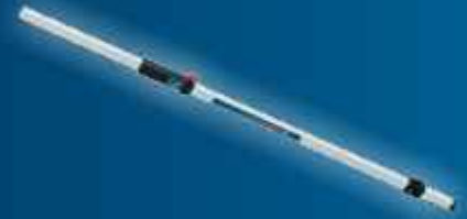
GR 240 ölçme çubuğu