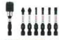
Impact Control Vidalama Ucu Paketi HT+PH/PZ/T*50mm 7'li 2 608 522 327