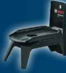
RM 1 döner montaj aparatı