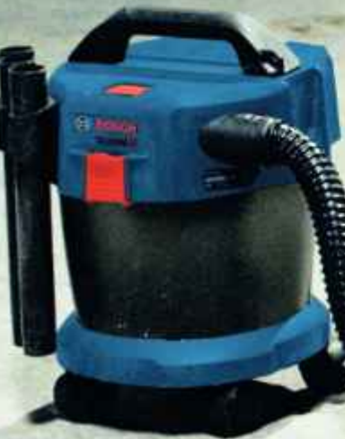
GAS 18V-10 L