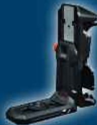
LB 10 + DK 10 tavan klipsi